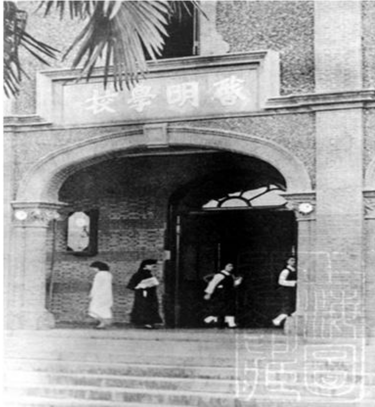
杨绛先生笔下的（昔日的）启明学校长廊。