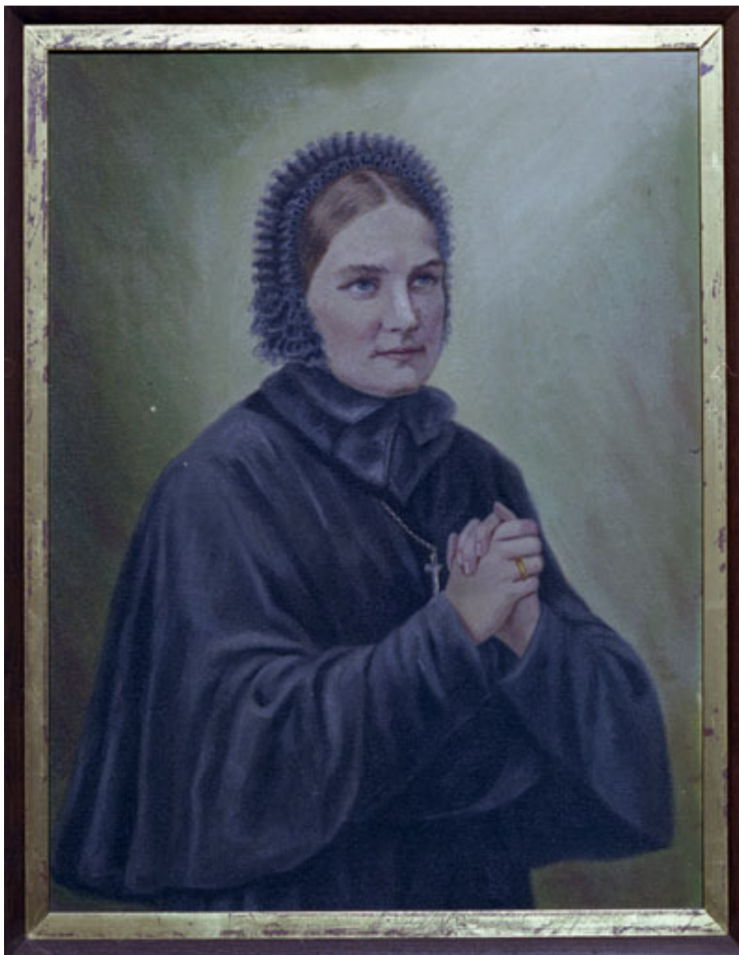
拯望会会祖真福主顾玛利亚姆姆

拯望会在上海徐家汇圣母院通过举办育婴堂和孤女院收养过万余名孤残弃婴，同时还为孩子们办有幼稚园、聋哑学堂等。圣母院内的刺绣间、裁缝间、洗衣场等服务机构以及上海土山湾工艺品厂为孩子们提供了工作场所。