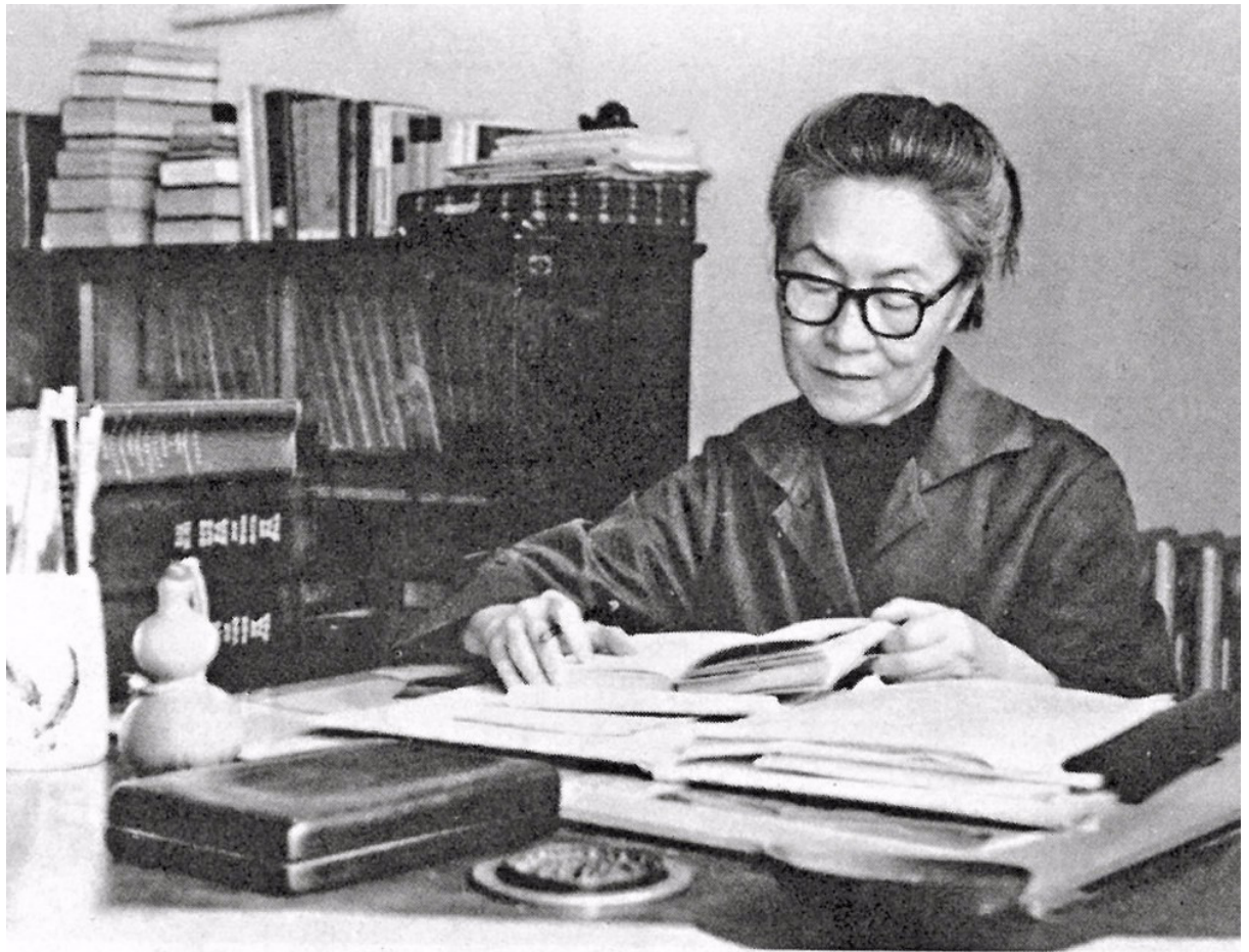
启明女校的著名校友杨绛先生——钱钟书先生的夫人

虽然拯望会姆姆们用宗教性的“清规戒律”严格要求和教育孩子们，其学校以管理严格而著称，但传教士们融合中西科学文化艺术的全人教育办学深获民心、欣赏、接纳。一如启明女校的校友杨绛先生在晚年（2002年）曾这样深情回忆其启蒙母校：“我爸爸向来认为启明教学好，管束严，能为学生打好中文、外文基础，所以我的二姑妈、堂姐、大姐、二姐都是爸爸送往启明上学的。”（杨绛《我在启明上学》）启明女校成了杨绛先生的爸爸为其家人读书的首选。