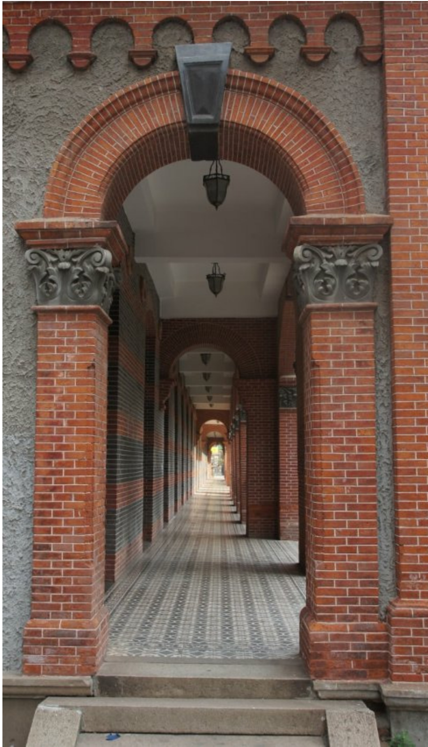
杨绛先生笔下启明女校长廊（上下图：今日修缮后的长廊）。