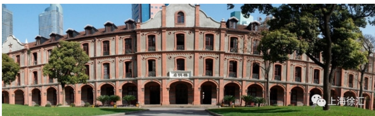
今日修缮一新的启明楼