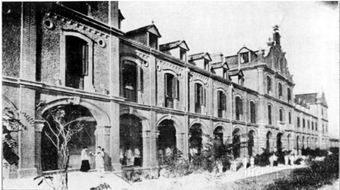
杨绛先生笔下（昔日）的启明楼

“我们教室前的走廊好长啊，从东头到西头要经过十几间教室呢！” 在杨绛先生的笔下，不但启明为她很大，而且那是她的“新世界”，什么都新奇！以至于近一个世纪后，这位走遍世界的世纪老人仍然难以忘怀昔日爱护她们的姆姆