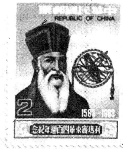
台灣發行的兩款利氏郵票