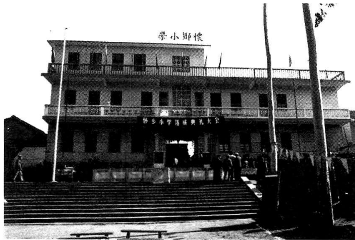
△ The story printed in the Guangxi Daily.