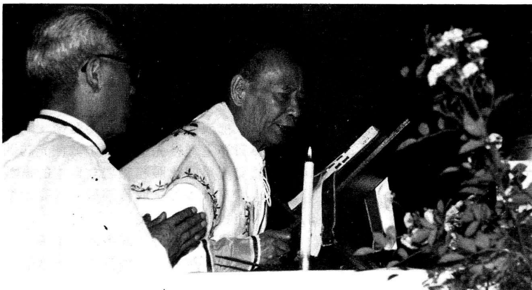
葉蔭雲主教舉行彌撒

讓我們祈求天主的降福，賞賜廣州天主教會新的基礎上取得更大成就。願主的旨意奉行在人間，如同在天上！