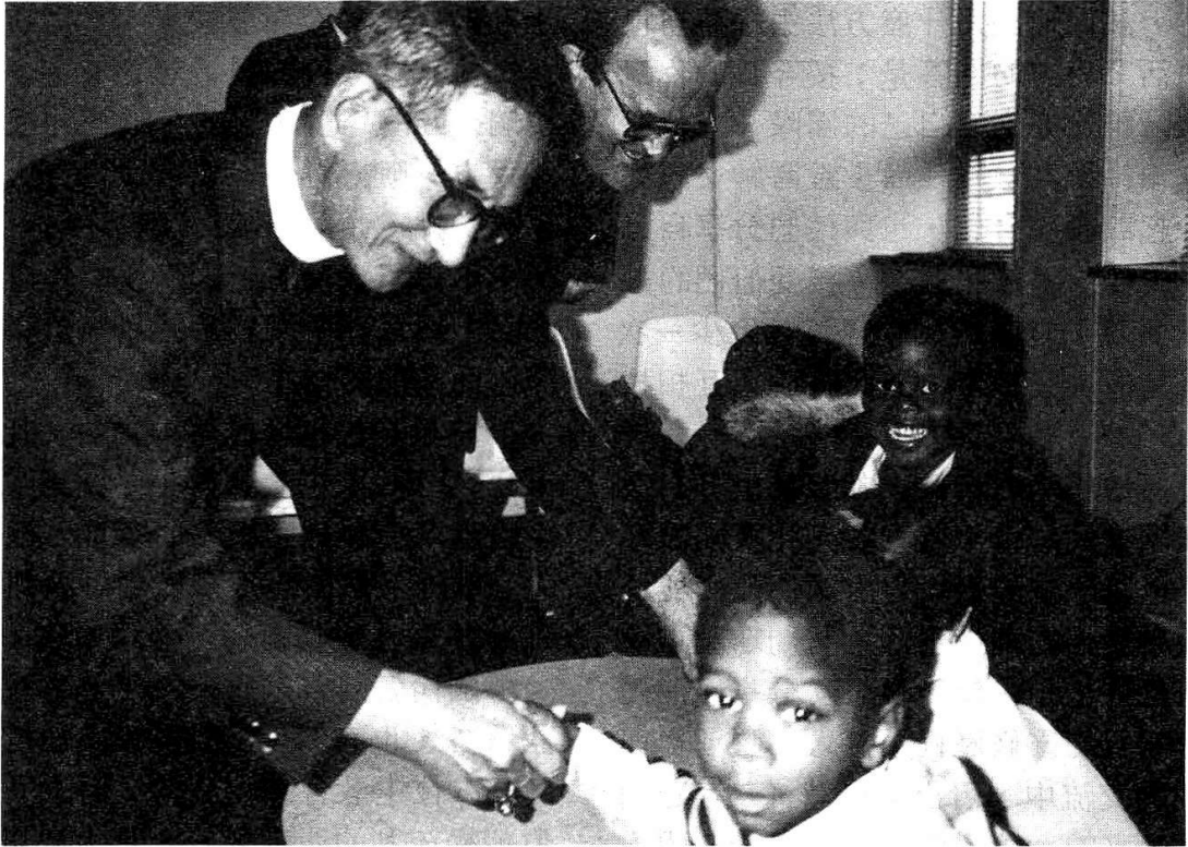
涂世華主教參觀新澤西紐華克教區社會服務機構