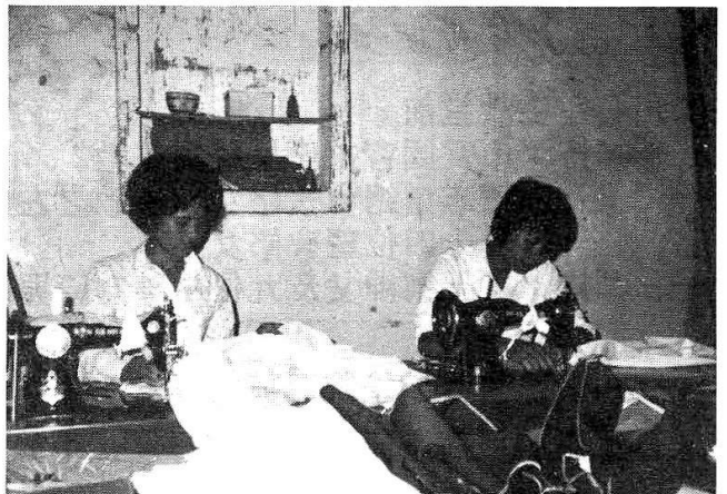
她們從事車衣生產的情況