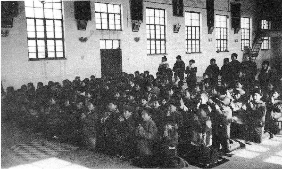
虔誠的北方小朋友。 Sincere children in Northern China.

存保神父仍回石家莊信德編輯室，董建強神父在河北神學院任教，張世斌和王東成兩位神父則在教區任牧靈工作。